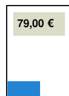
90 x 50 mm