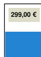
184 x 135 mm (1/2-Seite, quer)