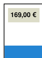
184 x 70 mm (1/4-Seite, quer)