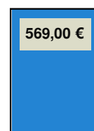
184 x 270 mm (Ganze Seite)

Die Ausführung von Anzeigen-Aufträgen erfolgt zu den Allgemeinen Geschäftsbedingungen für Anzeigen in Zeitungen und Zeitschriften und den zusätzlichen Geschäftsbedingungen des Verlages (werden auf Wunsch gern zugesandt).