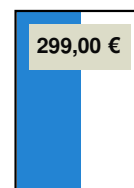
90 x 270 mm (1/2-Seite, hoch)